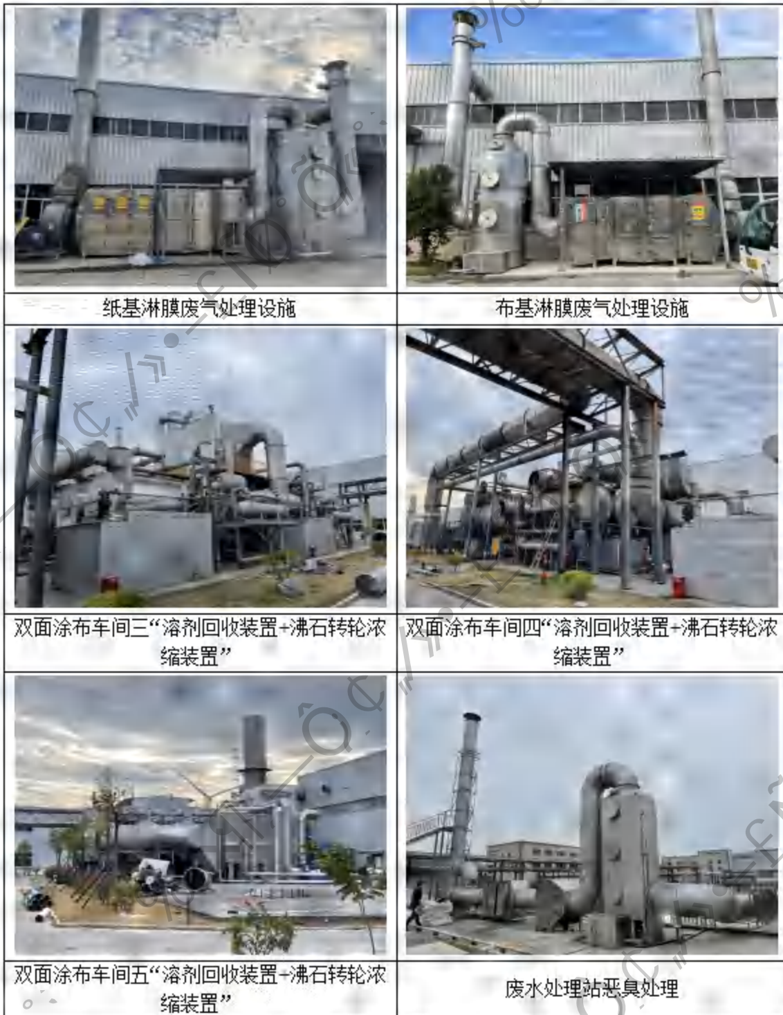
图 4.1-4 有组织废气治理设施