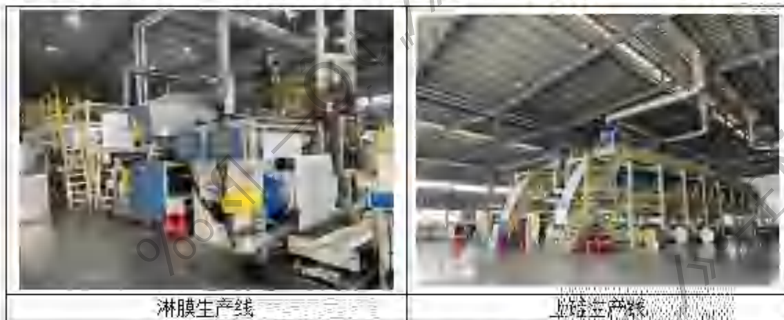
图 3.5-6 淋膜车间、上硅车间主要生产设施图

上硅： 将待离型涂布的纸放卷，通过涂布机的卷纸滚轮进行卷纸上料，然后在涂布区域内将离型剂均匀涂布于纸上，单面离型的为 PE 离型纸，双面离型的为双 PE 离型纸，涂布区域下方设置收集槽，回收过量的离型剂，本项目使用的离型剂分为有溶剂型离型剂（即以汽油为溶剂的硅油离型剂）和纯硅油型离型剂，涂布完成后，将纸送入涂布设备上方的烘干管道中进行烘干，烘干温度 110^{\circ}\text{C} 左右，使硅油粘附于纸上。