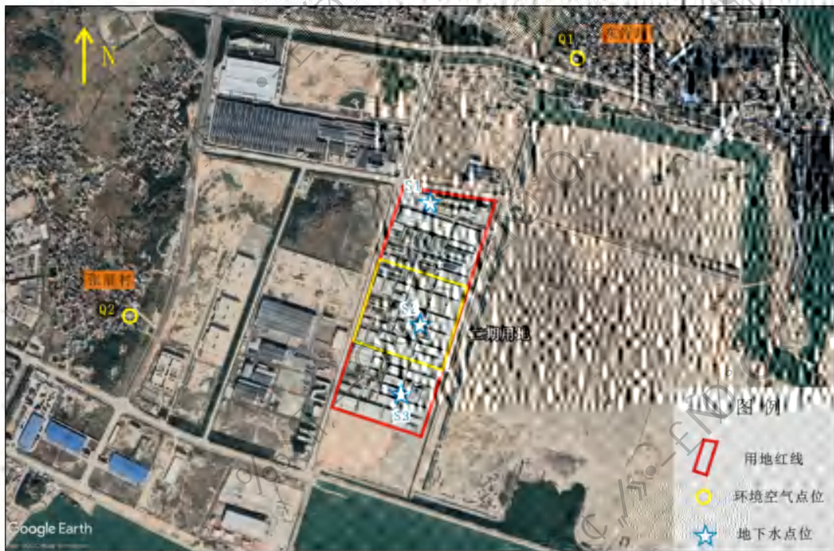
图7.2-1 环境质量监测点位图