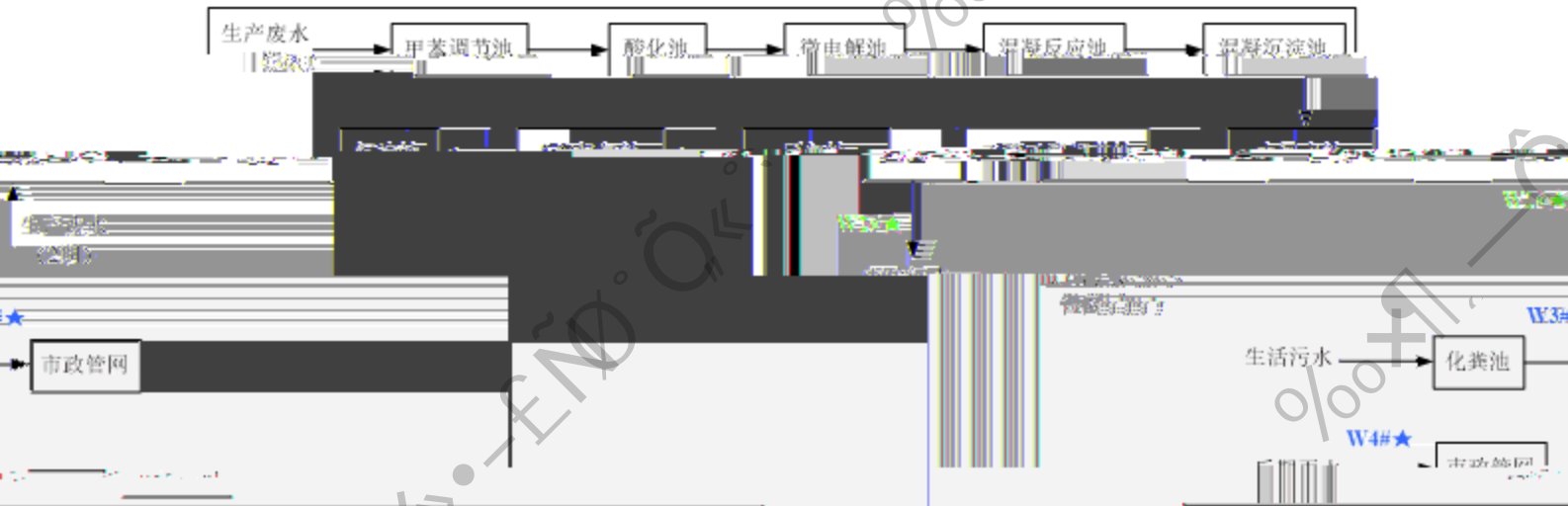
图 7.1-2 废水监测布点示意图